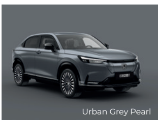
Urban Grey Pearl