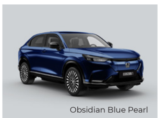
Obsidian Blue Pearl