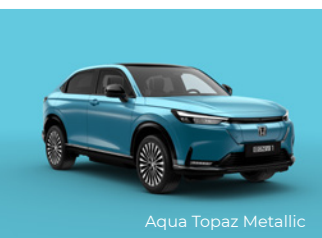
Aqua Topaz Metallic